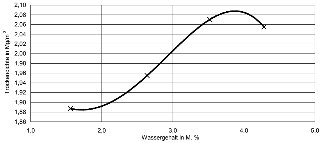
Proctorkurve des Baustoffgemisches 0/32 br. (FSS) gemäß Prüfzeugnis Nr. 40681SoB/19 vom 11.12.2019