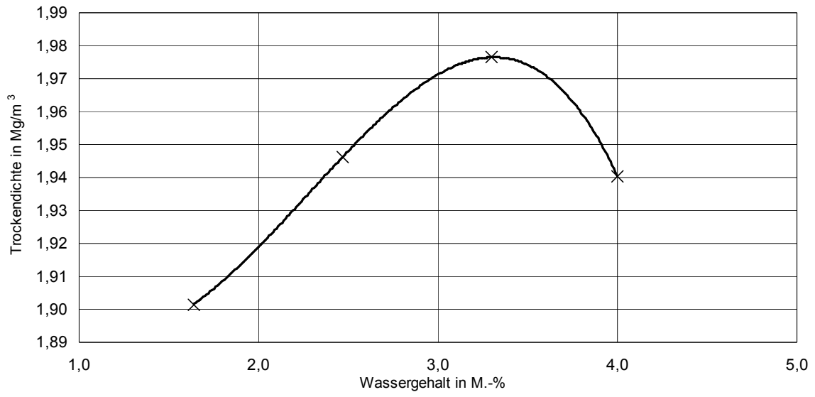
Proctorkurve des Baustoffgemisches 0/32 br. (FSS) gemäß Prüfzeugnis Nr. 42710SoB/21 vom 04.01.2022