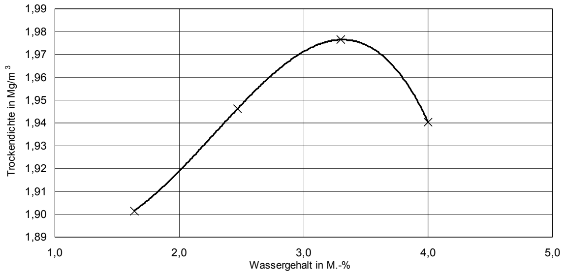
Proctorkurve des Baustoffgemisches 0/32 br. (FSS)